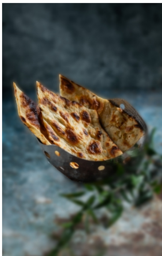
Butter Naan Vajas lepénykenyér