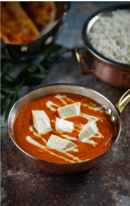
Paneer Makhnwala Vajas-Paradicsomos Sajt