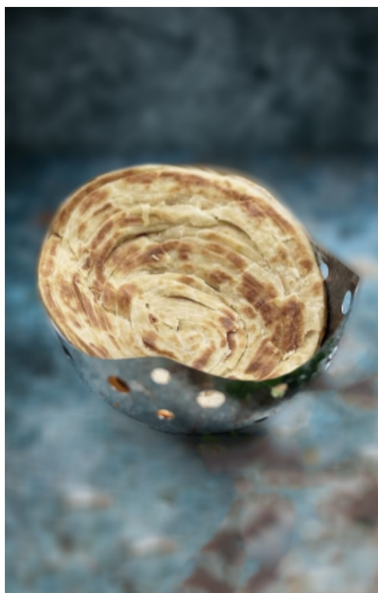
Laccha Paratha Leveles Paratha