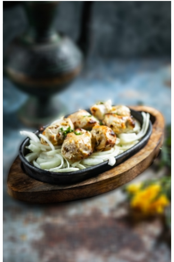
Malai Kabab Enyhén Fűszerezett Csirke Kabab