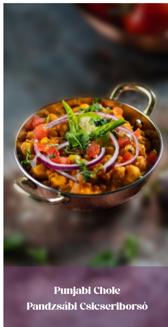
Punjabi Chole Pandzsábi Csicszeriborsó