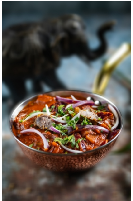
Lamb Do Pyaza Hagymás Báránycombok