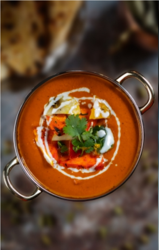
Paneer Tikka Masala Sajt Tikka Masala