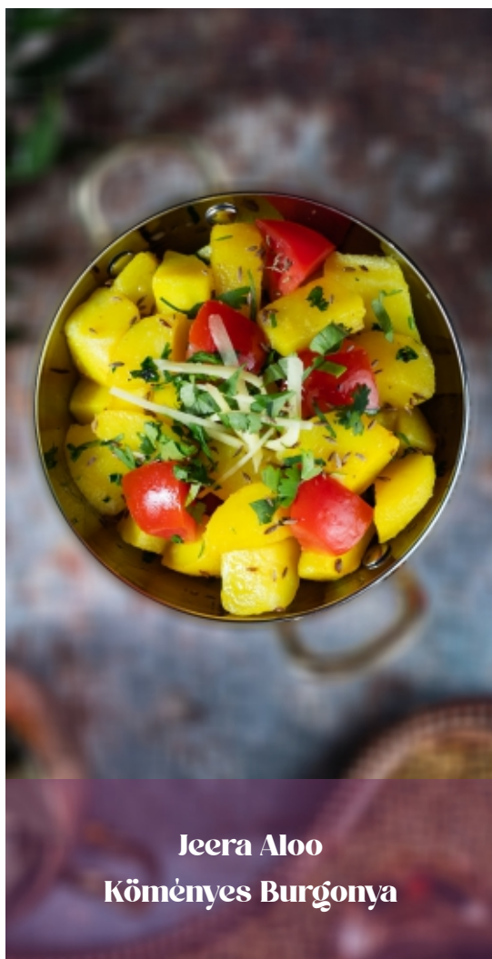
Jeera Aloo Köményes Burgonya