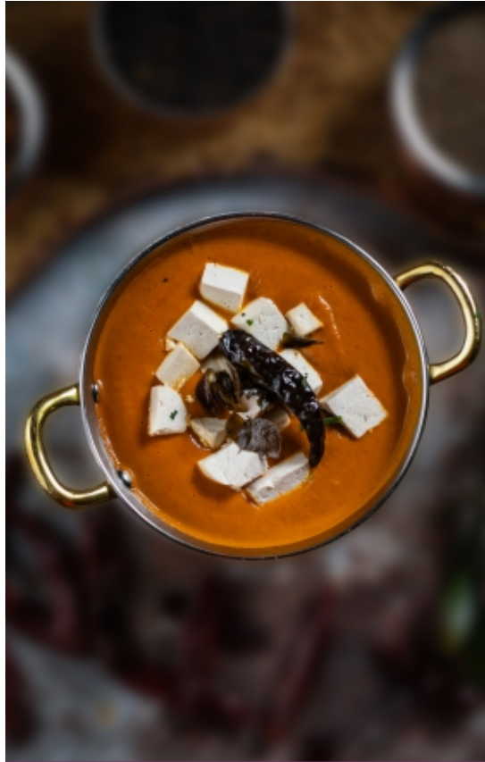
Madras Tofu Madras Tofu