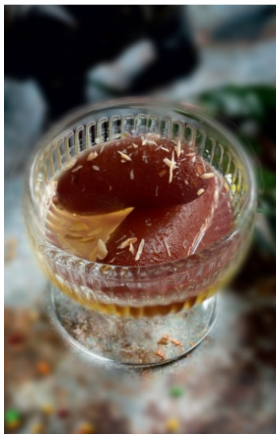
Gulab Jamun Sült Tejgolyó