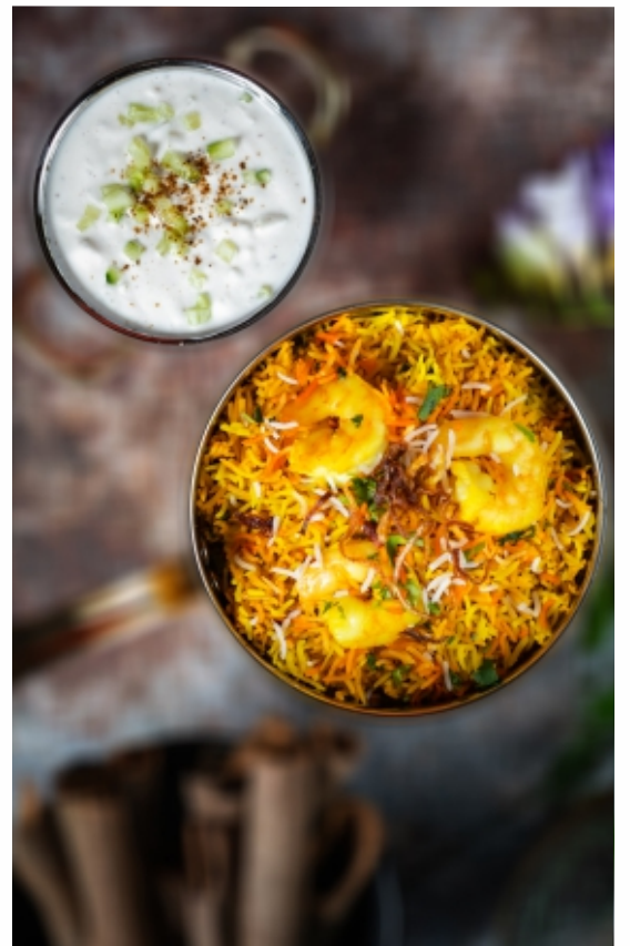
Prawn Biryani Rák Biryani