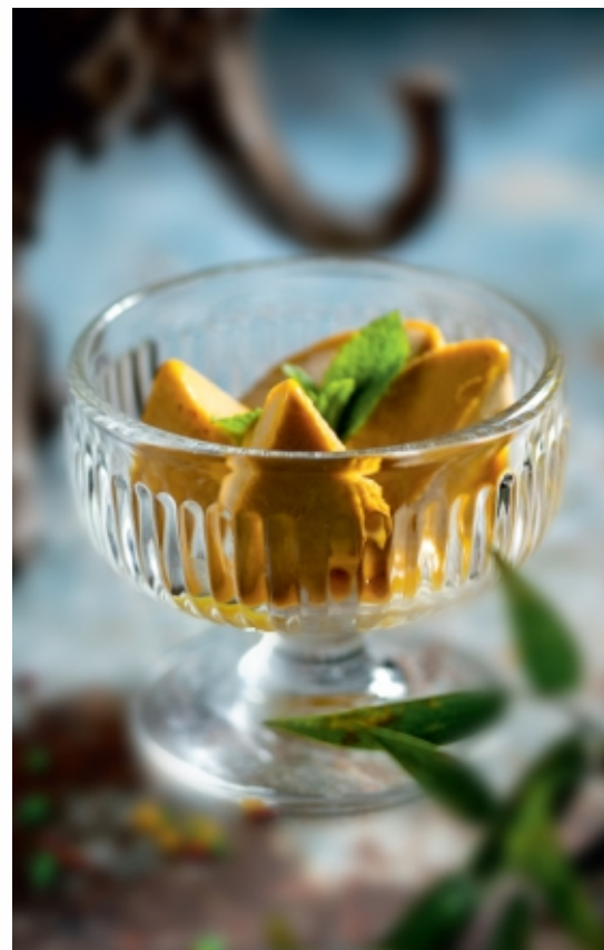
Mangó Kulfi Mangó Kulfi