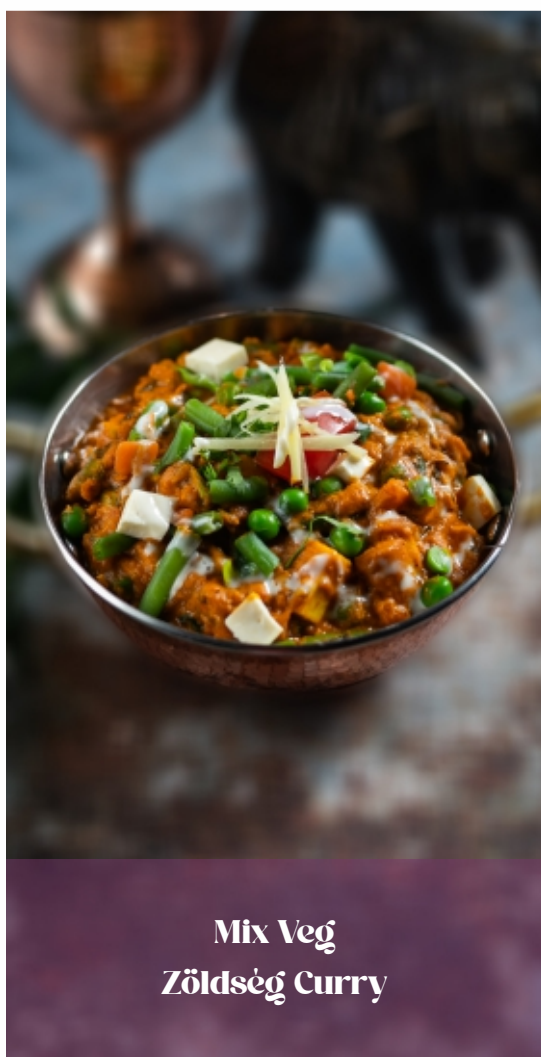
Mix Veg Zöldség Curry