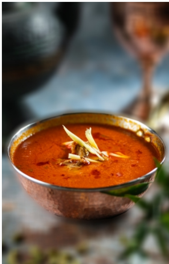
Rogan Josh Rogan Josh