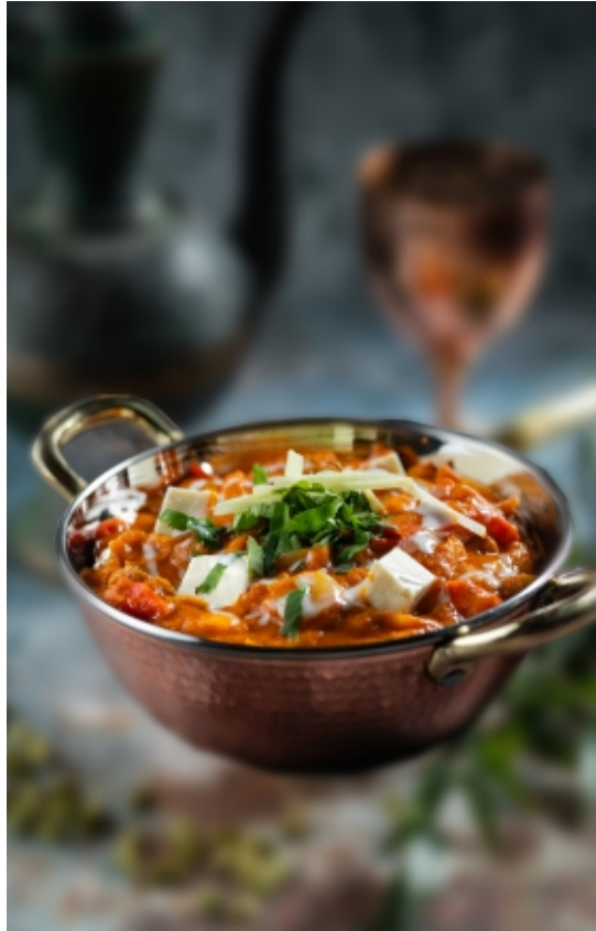
Kadhai Paneer Házi Sajt Kadhaiban