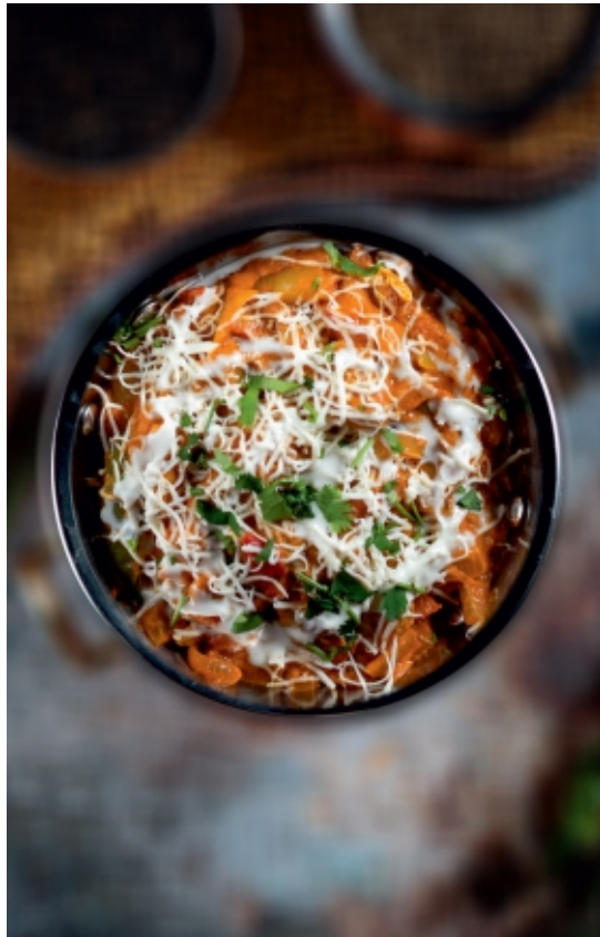
Indigo's Special Paneer Házi Sajt Indigo Módra