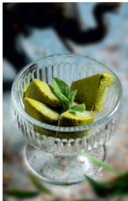
Pista Kulfi Pisztácia Kulfi