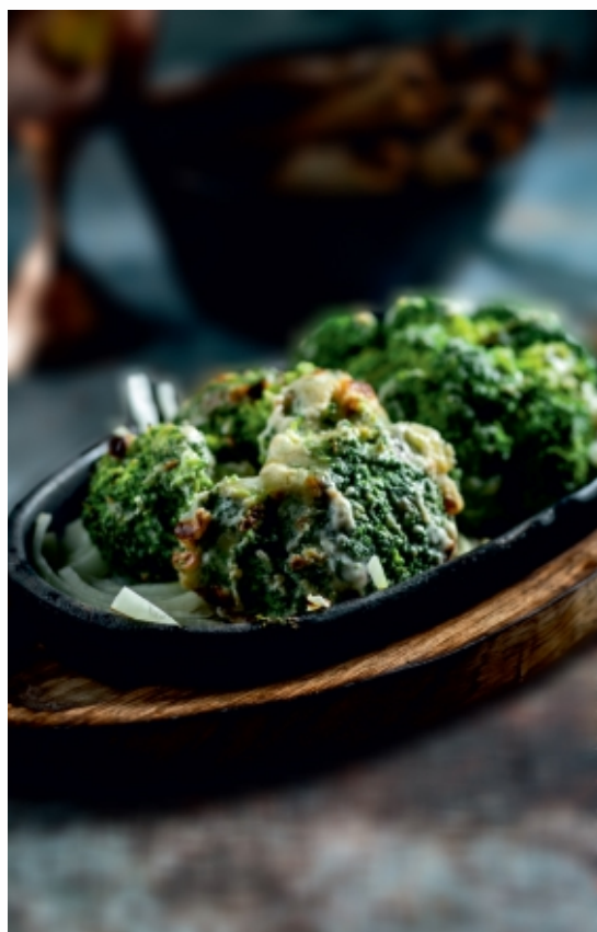
Malai Broccoli Krémsajtos Brokkoli