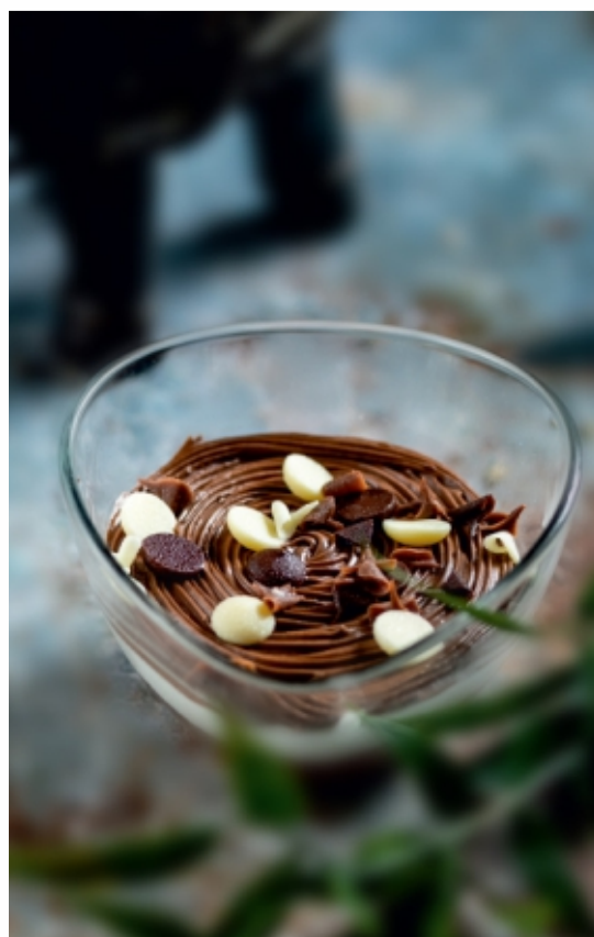
Chocolate Dream Csokoládé Álom