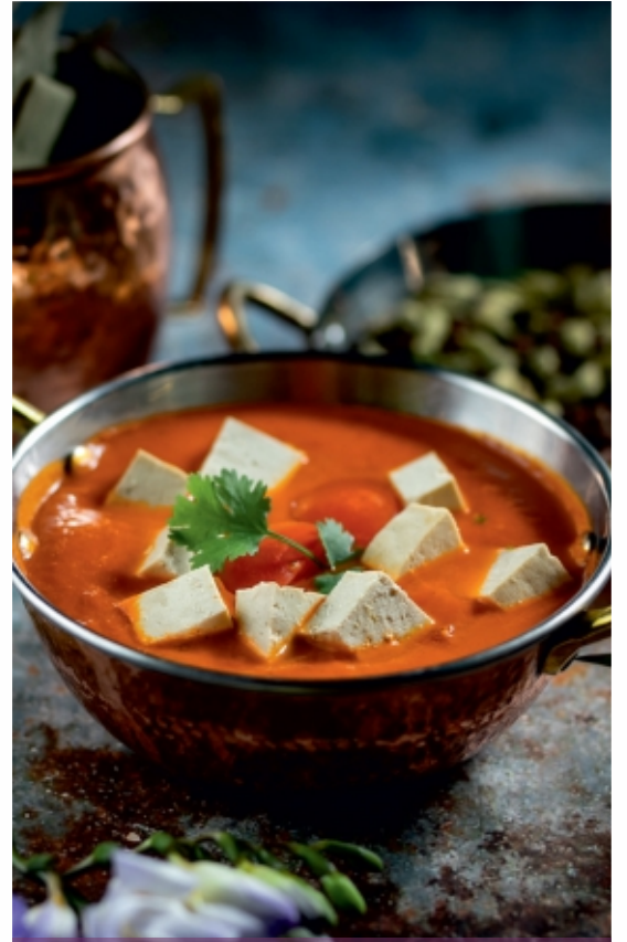
Tomato masala Tofu Paradicsomos Tofu