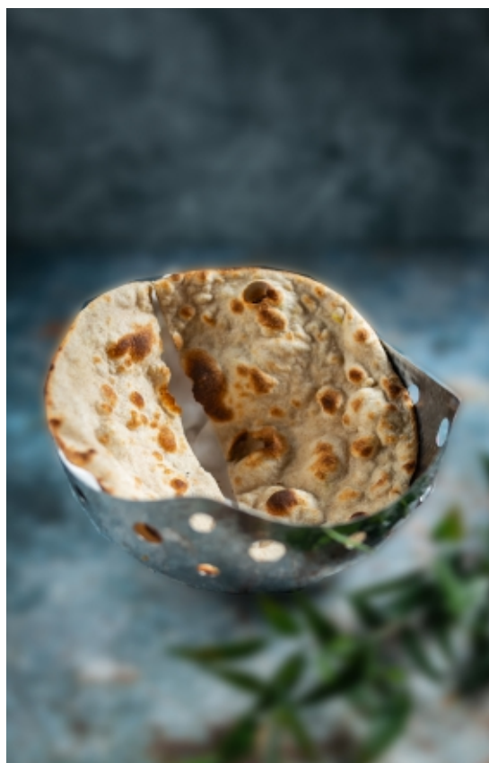
Plain Roti Tradicionális Roti