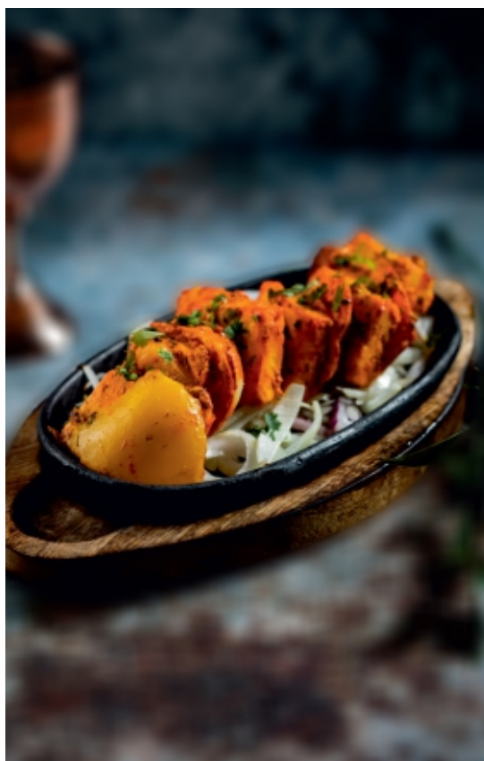
Paneer Tikka Sajtnyárs