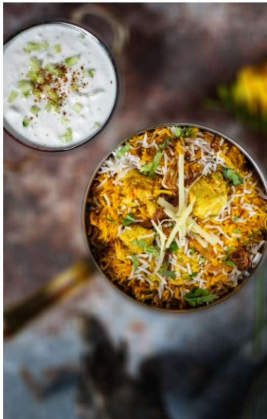
Chicken Biryani Csirke Biryani