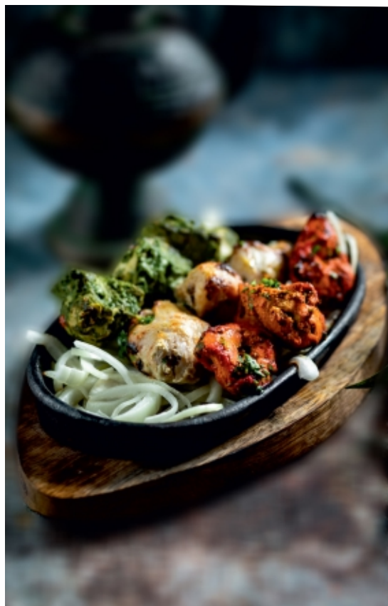
Indigo Tricolour Platter Indigo Tri kolor Tál