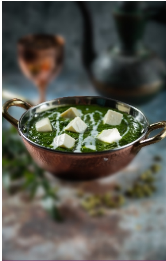
Madras Paneer Curry Madras Sajt Curry