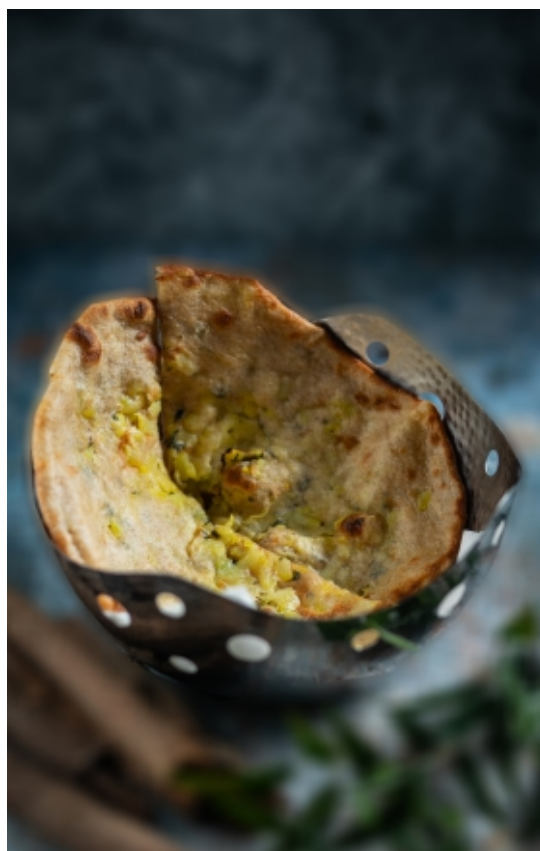
Aloo Paratha Burgonyás Paratha