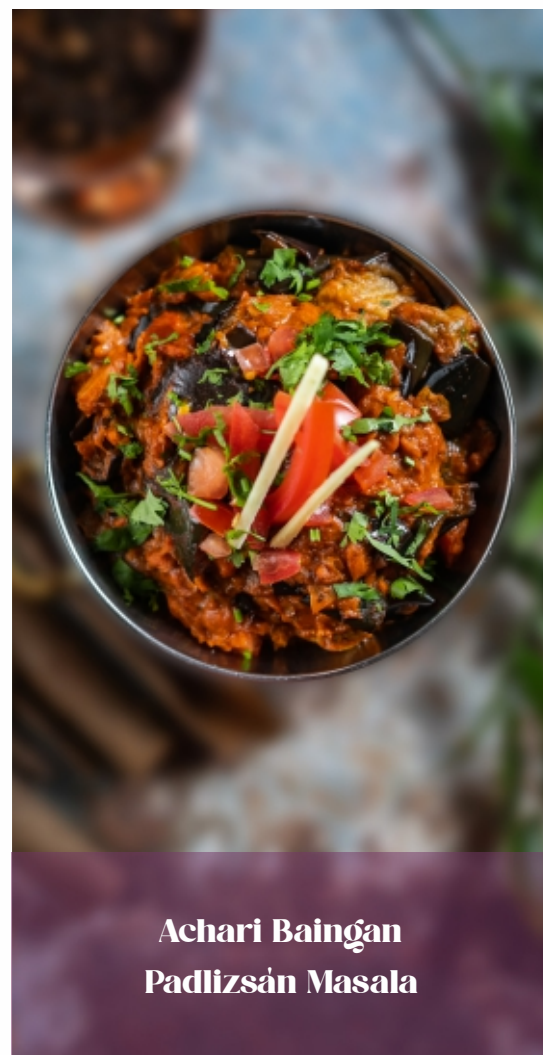
Achari Baingan Padlizsán Masala