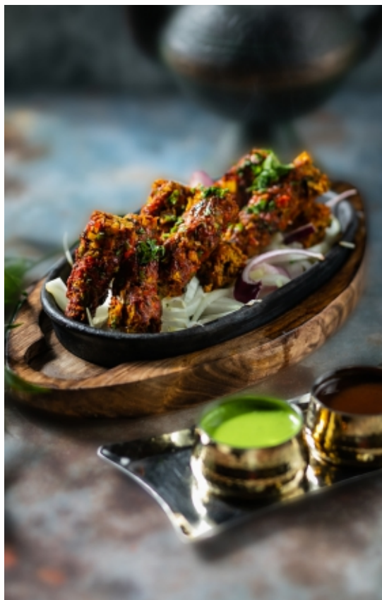
Gilafi (Seekh Kabab) Darált Bányá Kabab